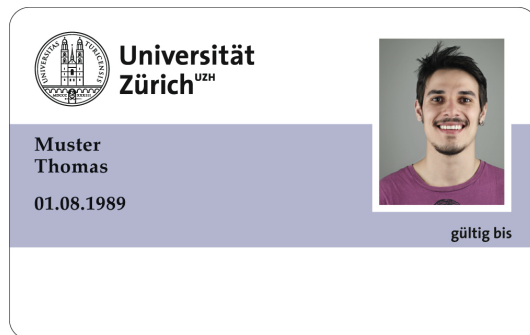
Empty thermal printing field