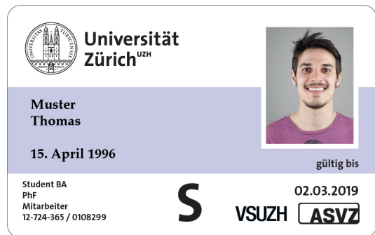
Printed thermal printing field